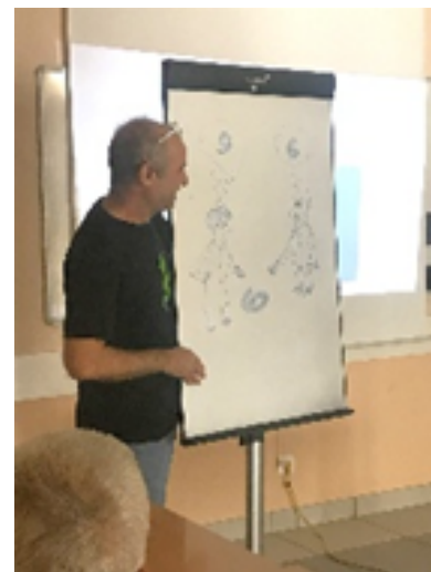
Formations à l'interculturalité à Strasbourg et Valdahon