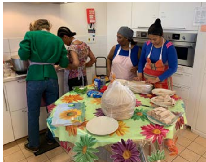
Les cuisinières viennent d'Erythrée.

Tous intervenants confondus, l'association compte une centaine de personnes. Ici, pas de différence notable entre bénévoles et salariés. Les réunions sont ouvertes à tous. Pas de gratuité non plus pour les usagères, qui payent leur adhésion avec de l'argent ou en rendant des services pour le fonctionnement quotidien de l'association : faire le thé ou la cuisine, donner un coup de main à l'imprimerie, etc.