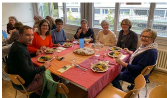
La table d'hôte de Camarada

En sortant de la visite, j'ai un peu le vertige. L'action de Camarada semble poursuivre un but gigantesque. Elle est pourtant d'une simplicité désarmante. Le poète Yves Bonnefoy a écrit un vers qui dit bien la difficulté de l'exil : « Ici devient là-bas, sans cesser d'être ». Et c'est comme si Camarada donnait aux femmes les clés de cette possibilité.