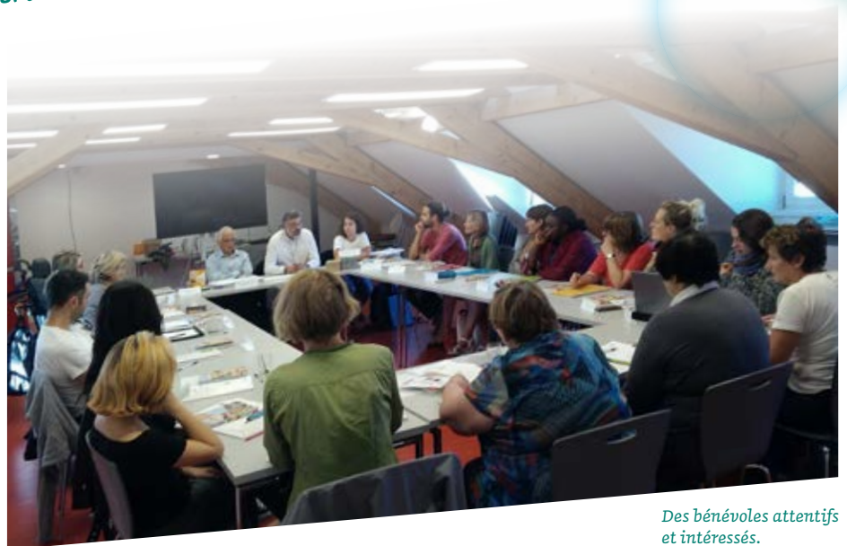
Des bénévoles attentifs et intéressés.